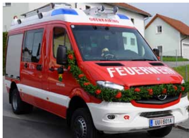
Das neue Kleinlöschfahrzeug