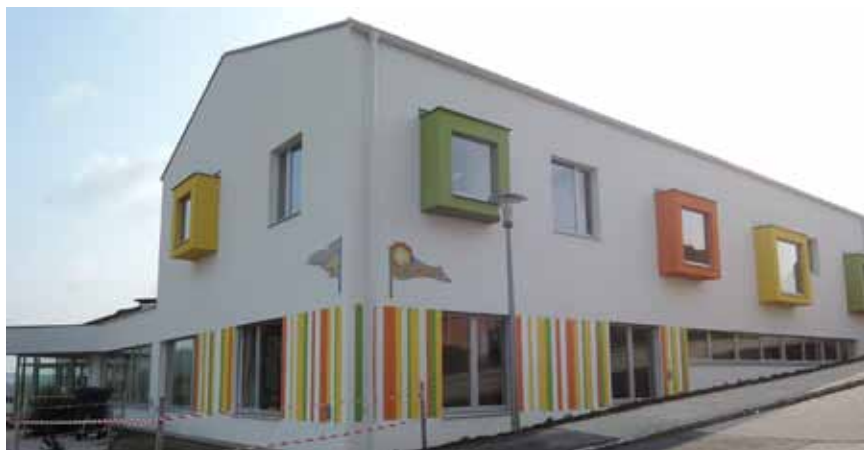
Kindergarten und Krabbelstube