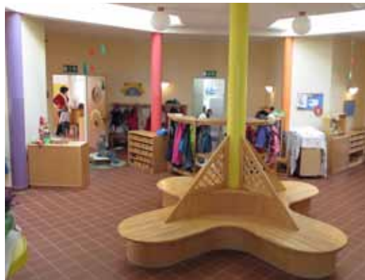
Alter Kindergarten im neuen Kleid

Wir freuen uns, wenn Kinder und Eltern gerne in unser Haus kommen.